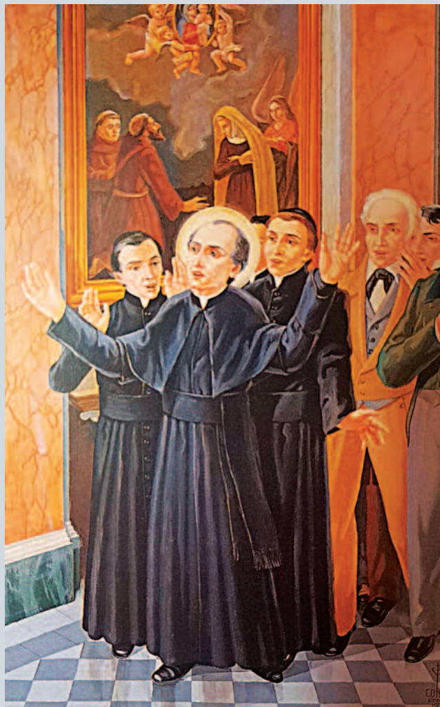
Dipinto di Giovanni Battista Conti

Il 29 settembre del 1837 don Vincenzo, a nome dell'Unione dell'Apostolato Cattolico, annunziò al cardinale Odescalchi la nascita della sua prima comunità nella chiesa dello Spirito Santo dei Napoletani. Così la presentò: «La Pia Società dell'Apostola-