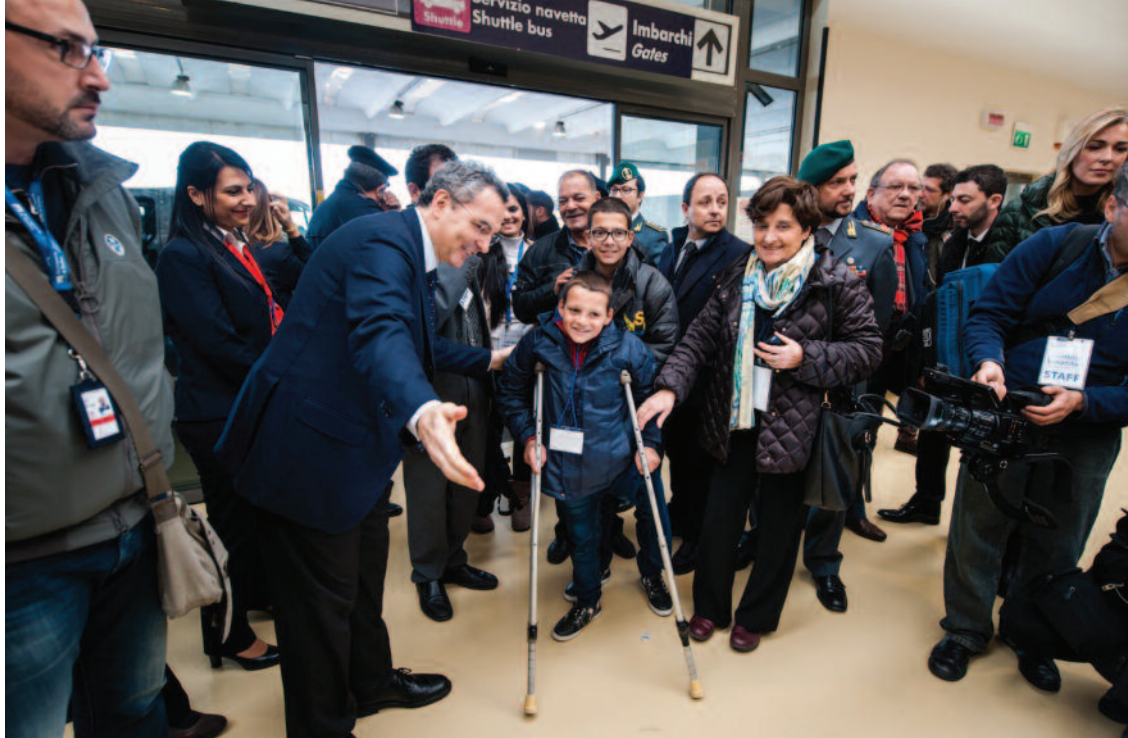
Il presidente di Sant'Egidio accoglie a Fiumicino profughi di un corridoio umanitario

povertà». E a volte a diventare povero può essere un intero popolo, come quello che apparve ai nostri occhi il Mozambico, dove erano da poco nate alcune comunità di Sant'Egidio: gente a cui era negato il futuro per una guerra civile che durava da 16 anni e aveva fatto un milione di morti. Sentimmo, di fronte a quella tragedia, che dovevamo fare qualcosa, come cristiani, perché la pace è una cosa troppo importante per lasciarla nelle sole mani degli Stati, dei politici o dei potenti di turno. Dopo due anni e mezzo di incontri, in cui imparammo la complessa arte della mediazione, le due parti in guerra (la Frelimo e la Renamo) firmarono finalmente a Roma l'accordo di pace il 4 ottobre 1992, giorno della festa di Francesco d'Assisi.