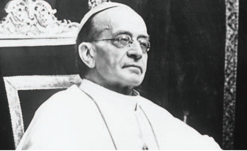
Papa Pio XI

Il titolo a san Vincenzo di "Antesignano dell'Azione Cattolica" venne dato da Papa Pio XI il 24 gennaio 1932: il processo di riappropriazione del carisma originario e dell'identità della fondazione intera iniziò grazie a tale dichiarazione. Così fu in qualche modo affermata una memoria perduta per accedere alla pienezza originaria dell'idea unitaria dell'Opera del Fondatore: l'Unione serve la Chiesa soltanto se le parti si sforzano insieme di essere unite.