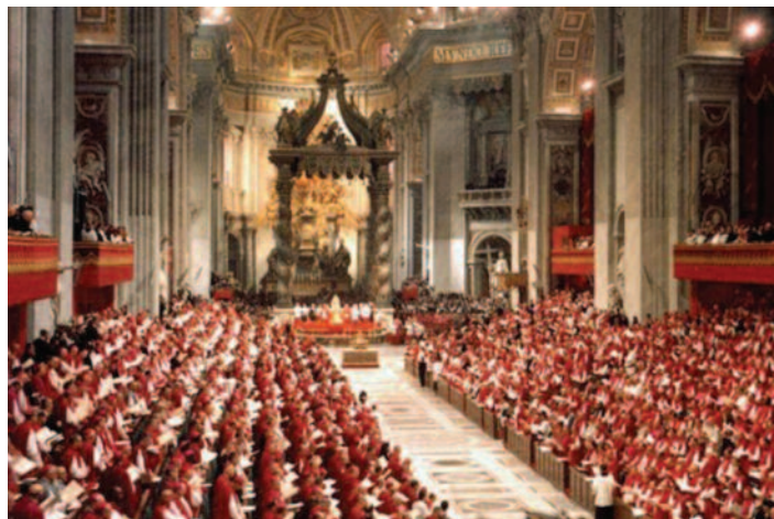
Uno scatto d'epoca del Concilio Vaticano II

Anche oggi Papa Leone riprendendo questi argomenti rinnova l'invito di diffondere queste novità che ancora non sono pienamente attuate; allora mettiamoci in ascolto di queste catechesi e in virtù del nostro Battesimo impegniamoci a far sì che questi documenti possano trovare pieno compimento nelle nostre comunità e nella Chiesa universale. ■