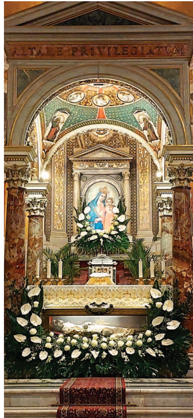
L'altare di San Salvatore in Onda