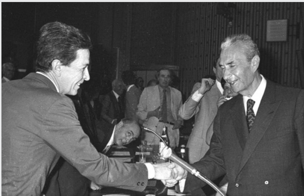
Enrico Berlinguer e Aldo Moro

tà che è dentro la nostra umanità e che richiede un grande impegno di crescita personale. Tutto ciò può spaventare. E qui c'è un ruolo (che potrebbe essere) grande della politica. Le idee possono essere scomode, possono anche apparire conflittuali ma, al contrario, se affrontate in una dialettica aperta, possono