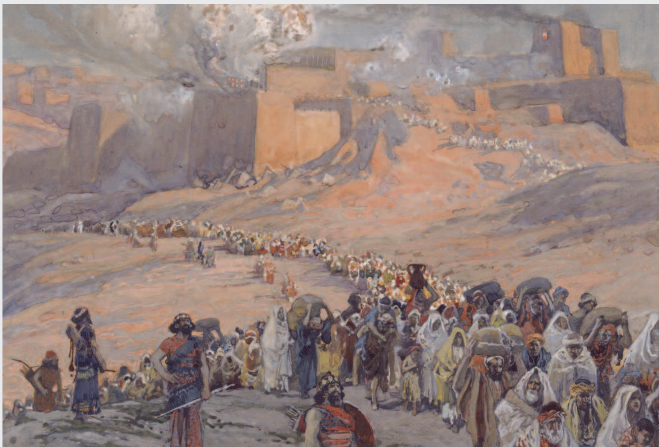
Il dipinto, realizzato da James Tissot nel 1896, raffigura la deportazione degli ebrei del Regno di Giuda a Babilonia, ordinata da Nabucodonosor II dopo la distruzione di Gerusalemme e del Tempio nel 586 a.C.

La radice šlm è presente nell'Antico testamento 116 volte nelle forme verbali e 358 volte in quelle nominali. La sua traduzione è controversa: legan-