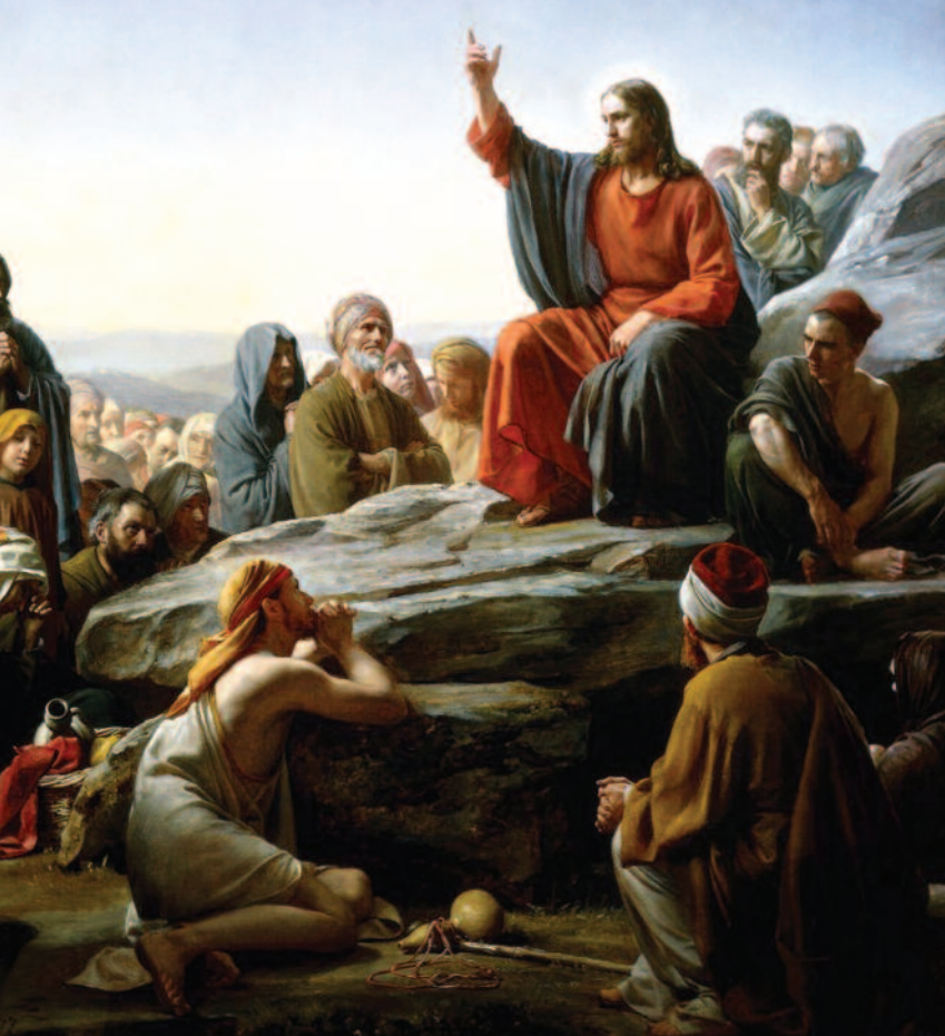
Il discorso della Montagna (Carl Heinrich Bloch, 1877). «Beati gli operatori di pace»