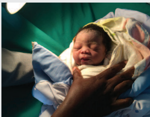
Il neonato nell'ambulatorio delle Suore Pallottine

Ben sappiamo che le divisioni, l'odio, la violenza, la guerra sono presenti ovunque, non solo in Ucraina e Palestina. Ma come il popolo ruandese, cerchiamo ovunque di aderire con il cuore, la mente e le mani al messaggio molto bello della Madre della Parola, 'Nyina wa Jambo', a Kibeho quando così dice: «Figli miei, voi siete i miei fiori e dovete annaffiare i miei fiori e la bellezza dei fiori è che hanno colori diversi».