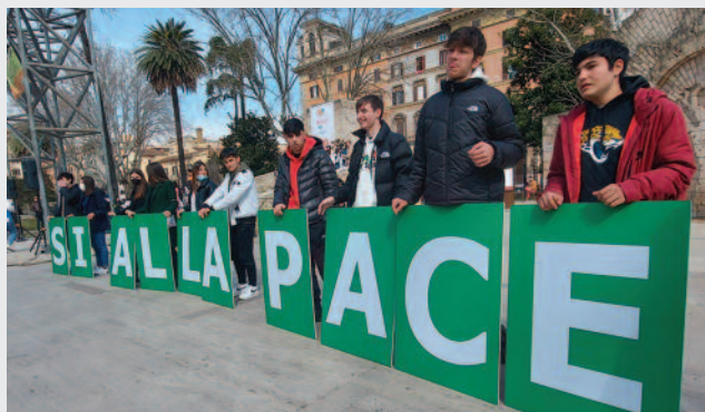
Manifestazione a Piazza Vittorio (Roma) dei ragazzi delle Scuole di pace di S. Egidio

In teoria sembra semplice. Insegnando con atti e parole, con ragionamenti convincenti e azioni coinvolgenti e sincere non è possibile non favorire la nascita di questi anticorpi. Il Bene è diffusivo per se stesso, giusto? Il Bene è contagioso, esatto? L'appello al Bene risuona nel cuore di tutti, corretto? E tutte le religioni presenti in questo nostro mondo insegnano che la Pace è un valore fondamentale per una giusta e felice esistenza. Cristiani, Musulmani, Ebrei, Buddhisti, Shintoisti, Zoroastriani, Animisti, tutti dicono che la Pace è una cosa giusta e preferibile alla Guerra. Che il Bene è preferibile al Male. A parole siamo tutti d'accordo. Allora perché c'è la guerra? Perché Ucraina? Perché Gaza?