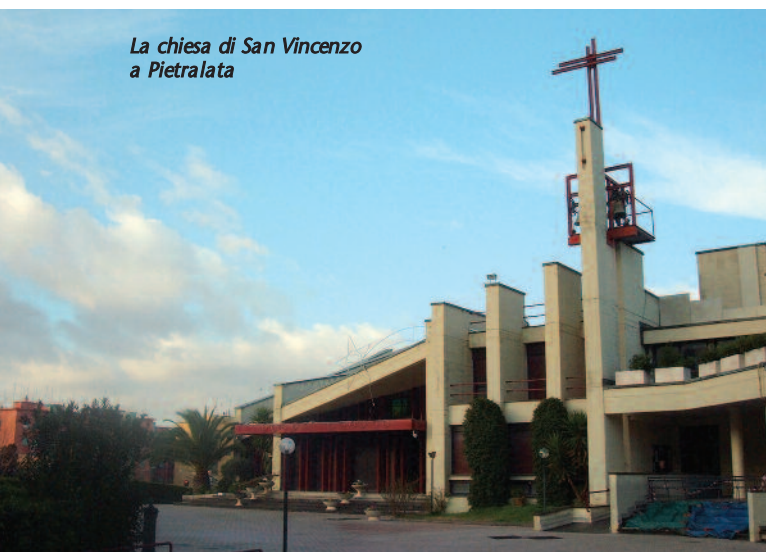
La chiesa di San Vincenzo a Pietralata